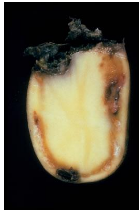
Fot. 1. Przekrój przez porażoną bulwę z zamierającymi wiązkami przewodzącymi

bakteria wywołująca chorobę ziemniaków zwaną śluzakiem (brązową zgnilizną lub brunatną zgnilizną ziemniaka)