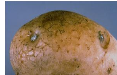
Fot 3 i 4. Wyciek śluzu z oczek bulwy i przekrój przez porażoną bulwę z zamierającymi wiązkami przewodzącymi