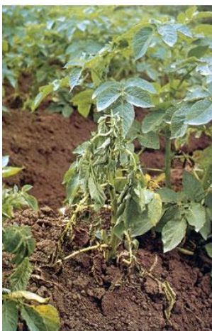
Fot 1 i 2. Wędnące rośliny ziemniaka