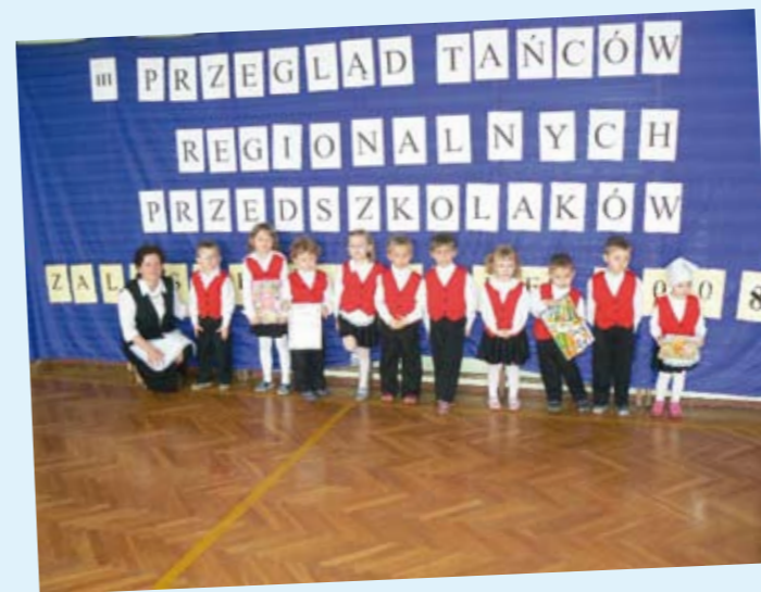
Występy podczas III Przeglądu Tańców Regionalnych Przedszkolaków