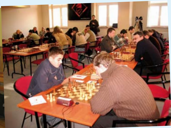
Międzynarodowy Turniej Szachowy o Puchar Burmistrza Leśnicy