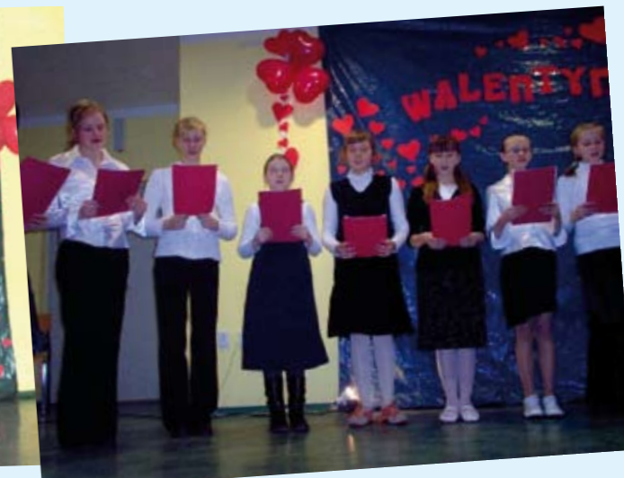
Walentynki w Leśnicy