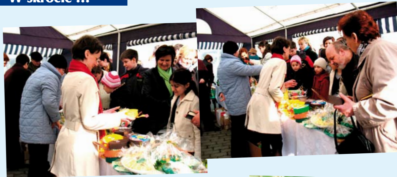
Akcja charytatywna Zespołu Parafialnego CARITAS w Leśnicy - więcej na str. 2