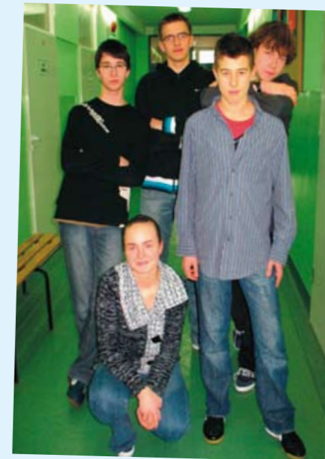
Olimpijczycy z Gimnazjum w Leśnicy - więcej na str. 13