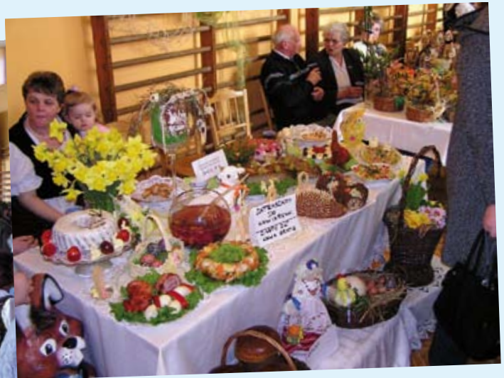
Wystawa Stołów Wielkanocnych w Leśnicy - więcej na str. 2