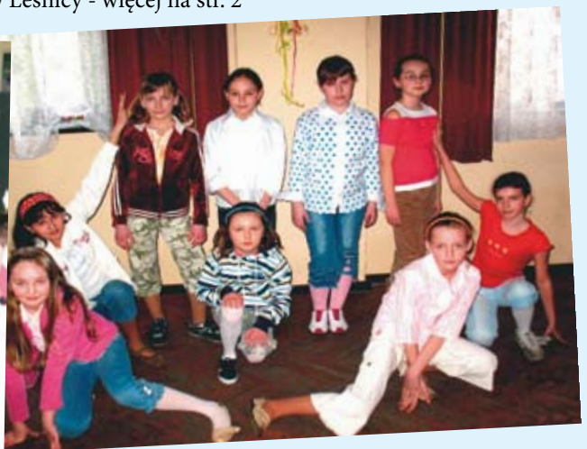
Występy podczas Dnia Kobiet w Raszowej - więcej na str. 3