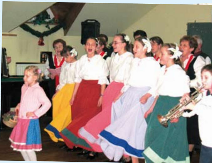
Dzień Babci i Dziadka w Leśnicy - występ grupy Frohsinn