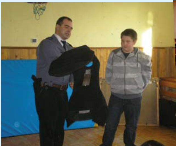
Spotkanie z Policją w SP Raszowa - więcej na str. 15