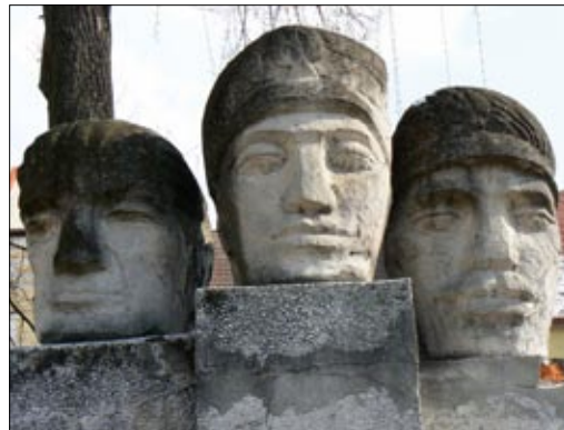
Fragment pomnika Powstańców Śląskich

Powstańczego zlokalizowane na granicy Leśnicy i Góry Św. Anny. Zapis ten, należy traktować jako wskazanie właściwego miejsca dla pomnika Powstańców, gdzie stanowiłby całość tematyczną