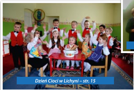
Dzień Cioci w Lichyni – str. 15