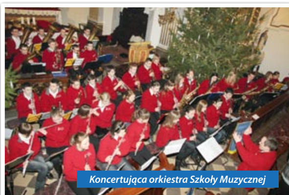
Koncertująca orkiestra Szkoły Muzycznej