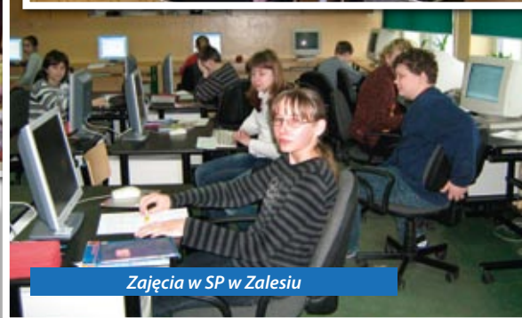
Zajęcia w SP w Zalesiu