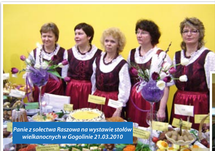
Panie z sołectwa Raszowa na wystawie stołów wielkanocnych w Gogolinie 21.03.2010