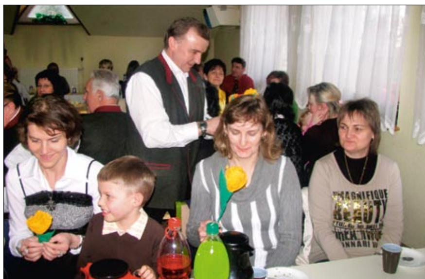
Wszystkie Panie w doskonałych humorach odbierają kwiaty i słuchają występów.

W ubiegłą niedzielę w sali OSP w Leśnicy odbyła się impreza z okazji Dnia Kobiet, której organizatorami byli Zarząd Osiedla Nr 1 w Leśnicy oraz Leśnicki Ośrodek Kultury i Rekreacji. Organizatorzy zapewnili bogaty program artystyczny. Dla licznie zebranych Pań wystąpił dziecięcy zespół taneczno-wokalny Marlenki, który przygotował skecz w którym dziewczynki musiały udowodnić