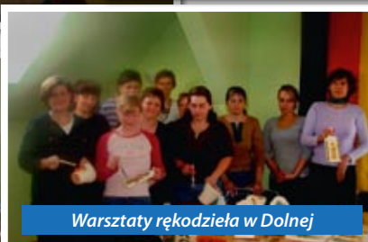
Warsztaty rękodzieła w Dolnej