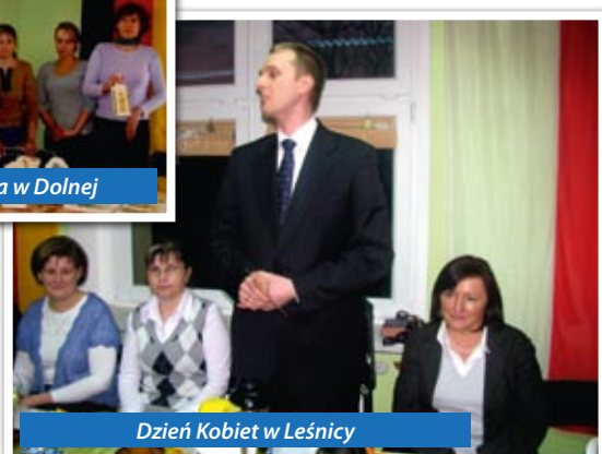
Dzień Kobiet w Leśnicy