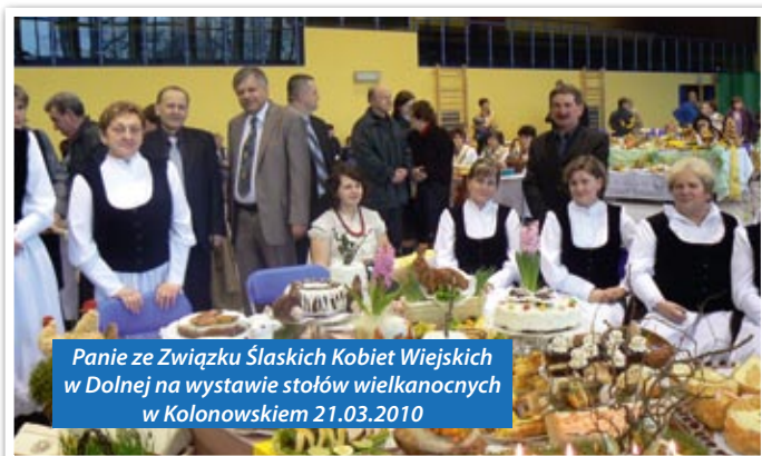
Panie ze Związku Śląskich Kobiet Wiejskich w Dolnej na wystawie stołów wielkanocnych w Kolonowskiem 21.03.2010

W bieżącym numerze znajdziemy m.in. informacje o wydarzeniach: