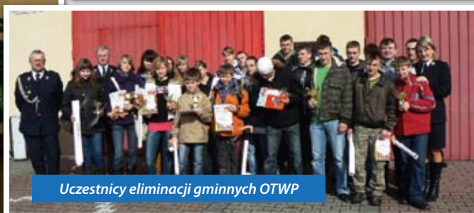
Uczestnicy eliminacji gminnych OTWP