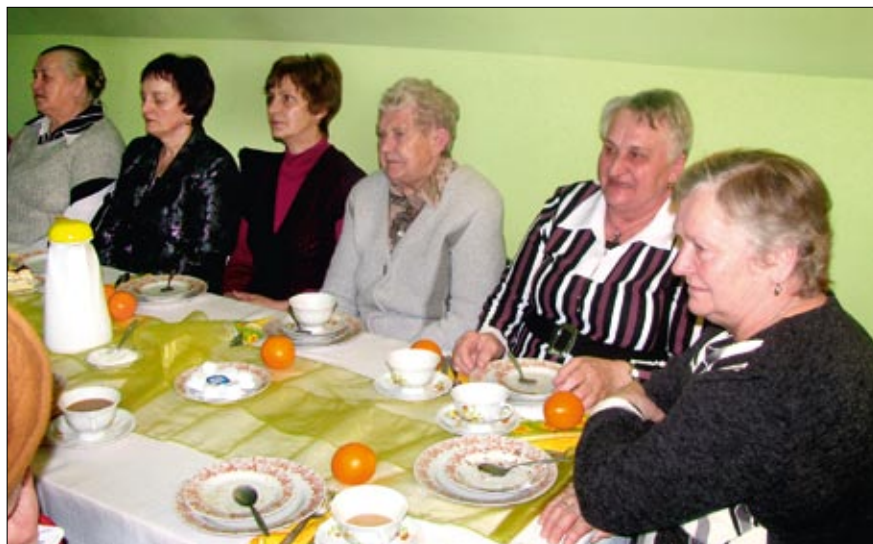
Panie z Dolnej spotkały się aby wspólnie porozmawiać i pobiesiadować.