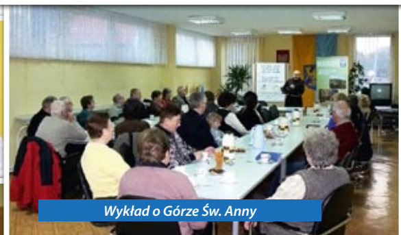
Wykład o Górze Św. Anny