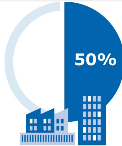
DLA ŚREDNICH FIRM